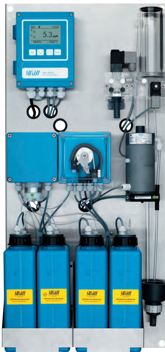
Monitor AMI Silica Scheda Tecnica nr. DitA25431300