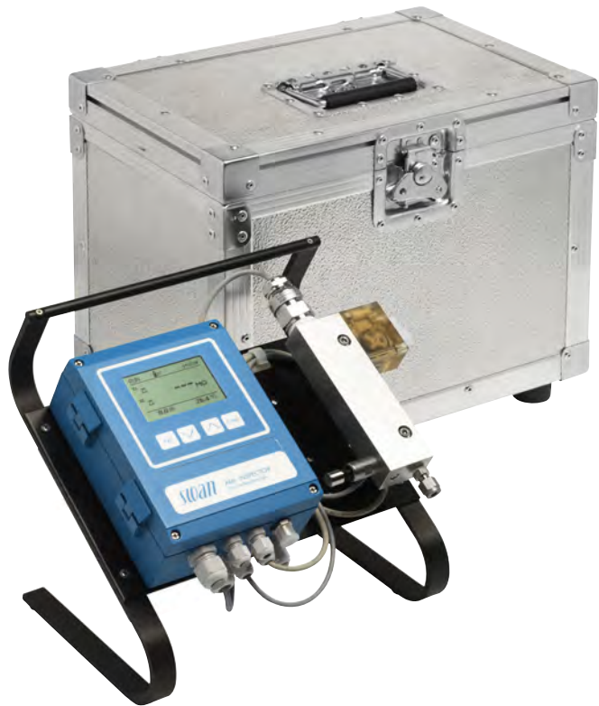
AMI INSPECTOR Scheda Tecnica nr.: vedi retro